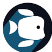
Aquarium de Lyon