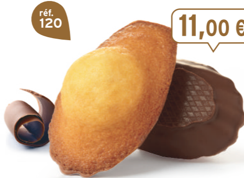
MADELEINES CHOCONOIR 50 emballages individuels - 1080 g - 10,19 €/kg DDM* : 2 mois