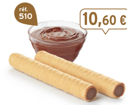
ROLINETTES CHOCONOISSETTES 45 étuis de 2 - 575 g - 18,43 €/kg DDM* : 5 mois