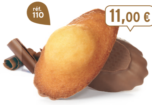
MADELEINES CHOCOLAIT 50 emballages individuels - 1080 g - 10,19 €/kg DDM* : 2 mois