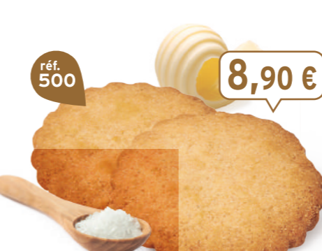
GALETTES 48 étuis de 2 - 880 g - 10,11 €/kg DDM* : 5 mois