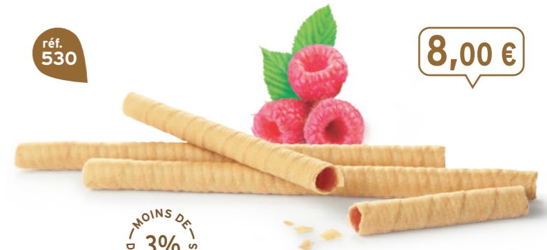
BRINS FRAMBOISE 7 étuis de 7 - 425 g - 18,82 €/kg DDM* : 5 mois