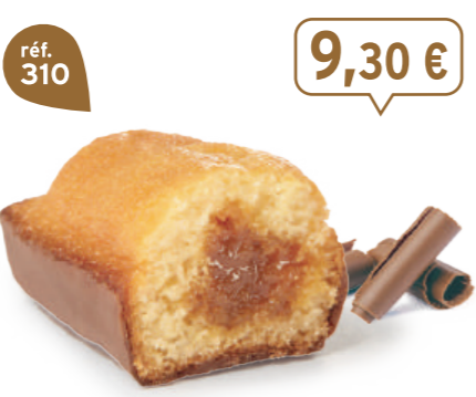
BIJOU CARAMEL CHOCOLAIT 20 emballages individuels - 740 g - 12,57 €/kg DDM* : 2 mois