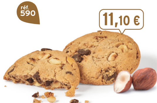
TRÉSOR NOISETTECHOCO 18 étuis de 2 - 585 g - 18,97 €/kg DDM* : 5 mois