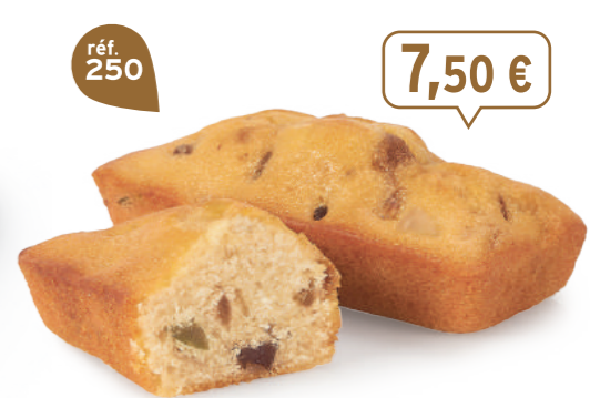
CAKES FRUITS 20 emballages individuels - 600 g - 12,50 €/kg DDM* : 2 mois