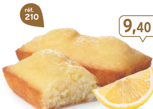
FONDANTS CITRON 30 emballages individuels - 660 g - 14,24 €/kg DDM* : 2 mois