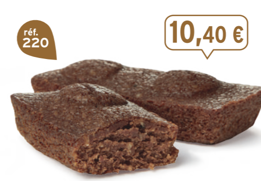
MŒLLEUX CHOCOLAIT 30 emballages individuels - 660 g - 15,76 €/kg DDM* : 2 mois