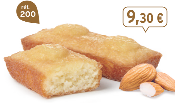
FINANCIERS AMANDES 30 emballages individuels - 660 g - 14,09 €/kg DDM* : 2 mois