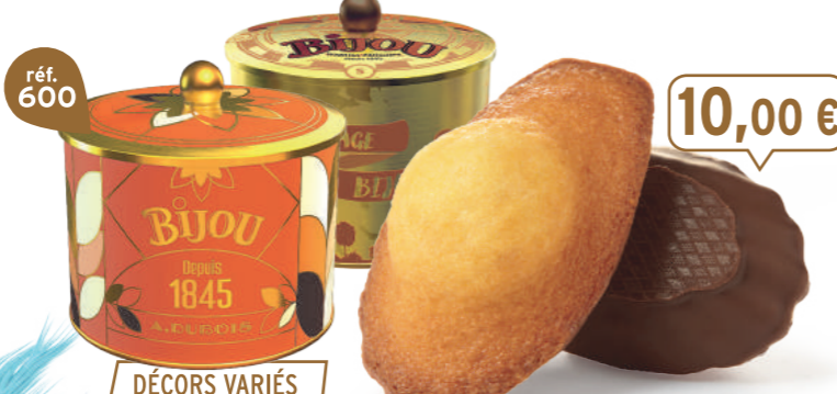
BOÎTE COLLECTOR MADELEINES CHOCONOIR 12 emballages individuels - 260 g - 38,46 €/kg DDM* : 2 mois