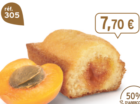
BIJOU ABRICOT 20 emballages individuels - 660 g - 11,67 €/kg DDM* : 2 mois