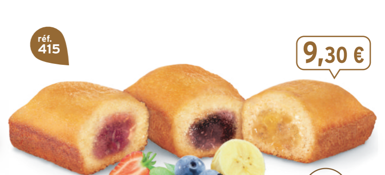
PANACHÉ DE BIJOU FRUITS 30 emballages individuels - 990 g - 9,39 €/kg 10 Bijou Fraise, 10 Bijou Myrtille, 10 Bijou Banane DDM* : 2 mois