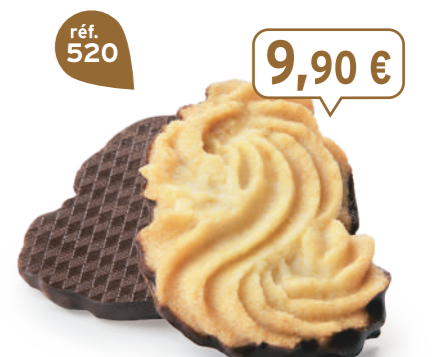
SABLÉS VIENNOIS 32 étuis de 2 - 620 g - 15,97 €/kg DDM* : 2 mois