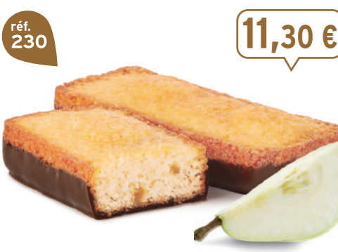
LINGOTS POIRE CHOCONOIR 25 emballages individuels - 675 g - 16,74 €/kg DDM* : 2 mois