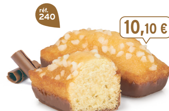
GÉNOIS CHOCOLAIT 30 emballages individuels - 920 g - 10,98 €/kg DDM* : 2 mois