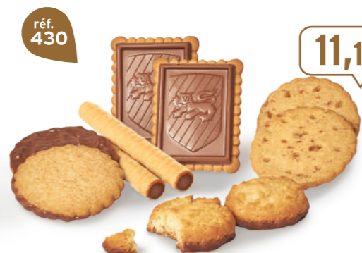
MÉLI-MÉLO DE BISCUITS 46 étuis de 2 - 900 g - 12,33 €/kg 8 étuis de 2 Rolinettes ChocoNoisettes - 10 étuis de 2 Craquants Cocolait 10 étuis de 2 ChocoSablés - 10 étuis de 2 Galettes Caramel d'Isigny 8 étuis de 2 Petits-Beurre Tablette Chocolait DDM* : 5 mois