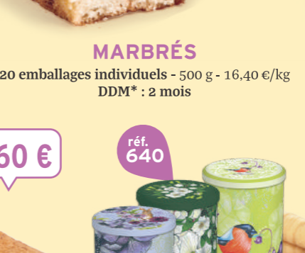
MARBRÉS 20 emballages individuels - 500 g - 16,40 €/kg DDM* : 2 mois