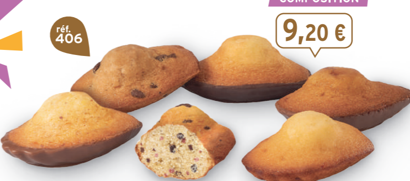
FARANDOLE DE MADELEINES 30 emballages individuels - 595 g - 15,46 €/kg 5 Madelaines Choconoir - 5 Madelaines Pépites - 5 Madelaines Citron - 5 Madelaines Noisette ChocoLait - 5 Madelaines Framboise Pépites - 5 Madelaines Caramel ChocoLait DDM* : 2 mois