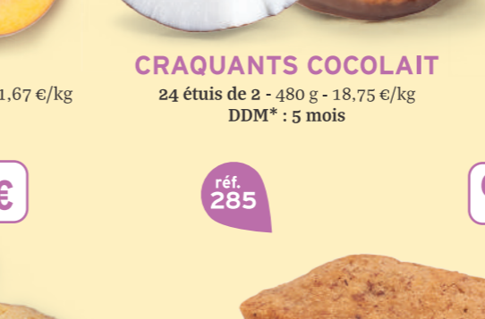
CRAQUANTS COCOLAIT 24 étuis de 2 - 480 g - 18,75 €/kg DDM* : 5 mois