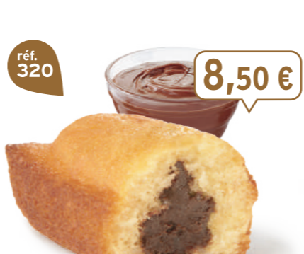
BIJOU CACAO 20 emballages individuels - 660 g - 12,88 €/kg DDM* : 2 mois