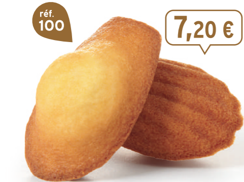
MADELEINES NATURE 50 emballages individuels - 880 g - 8,18 €/kg DDM* : 2 mois