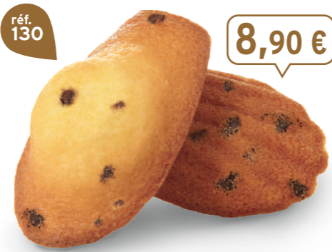
MADELEINES PÉPITES 50 emballages individuels - 900 g - 9,89 €/kg DDM* : 2 mois