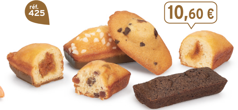
BOUQUET DE PÂTISSERIES 30 emballages individuels - 850 g - 12,47 €/kg 5 Madelines Pépites - 5 Gênois Chocolait - 5 Bijou Caramel ChocoLait 5 Bijou Pêche - 5 Mœlleux Chocolait - 5 Cakes Fruits DDM* : 2 mois