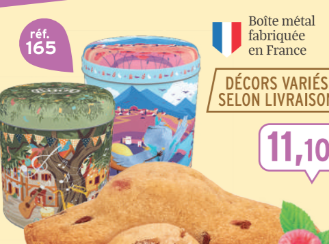
COFFRET MADELEINES FRAMBOISE PÉPITES 18 emballages individuels - 324 g - 34,26 €/kg DDM* : 2 mois