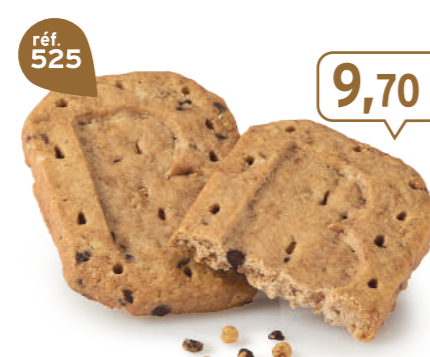
P'TIT-DEJ CHOCOCROUSTILL' 24 étuis de 2 - 670 g - 14,48 €/kg DDM* : 5 mois